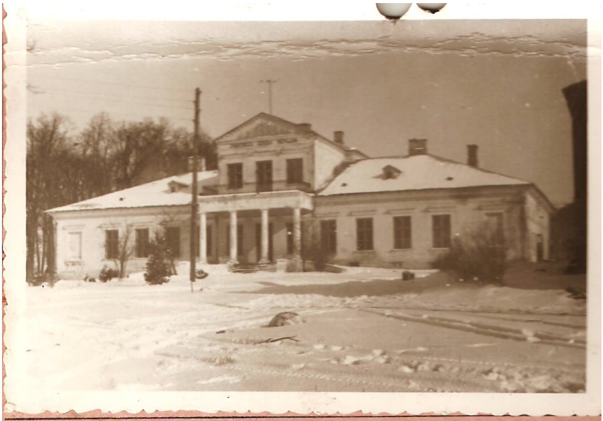
Pałac Zakrzewskiego siedziba Liceum Mechanicznego i Zasadniczej Szkoły Mechanizacji Rolnictwa 1958