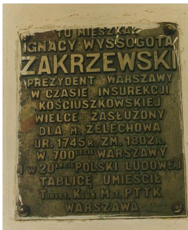
Pamiątkowa tablica wmurowana na frontonie pałacu Zakrzewskiego w 1964r. (w 2006 zaginęła)