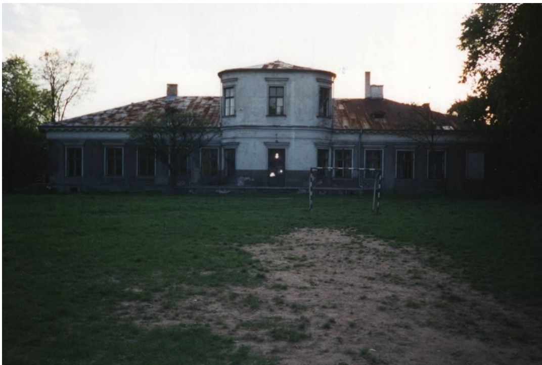
Pałac Zakrzewskiego - tył