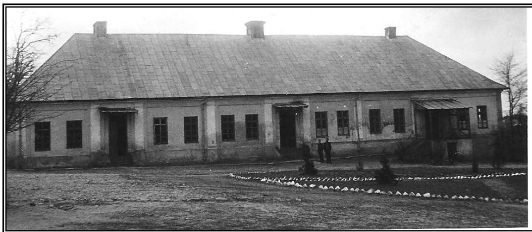
Oficyna Pałacu Zakrzewskiego - internat Państwowego Gimnazjum Mechanicznego k. lat 40. XXw.