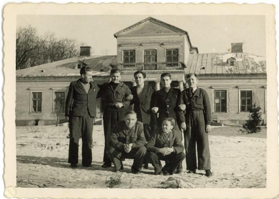
Pałac Zakrzewskiego lata 1946-48 siedziba Państwowego Gimnazjum Mechanicznego