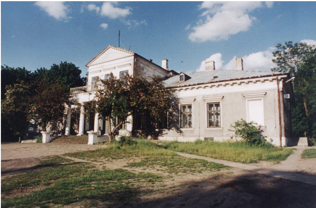
Pałac Zakrzewskiego - front