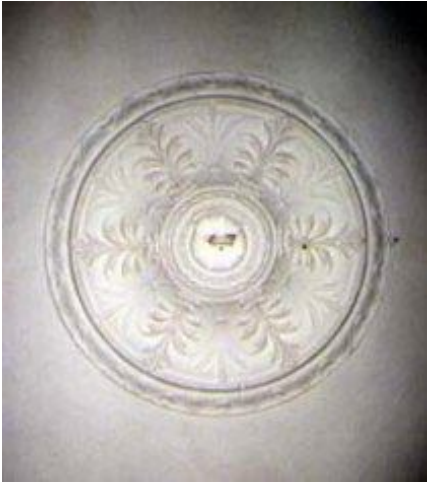
Ornamenty w pałacu Zakrzewskiego