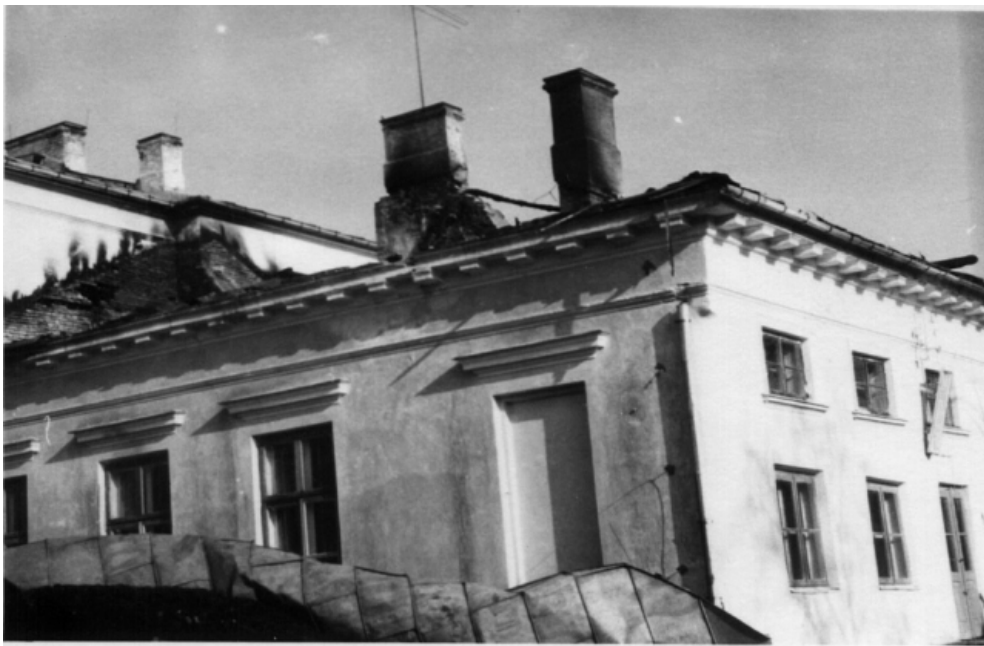
Pożar pałacu 1969r.