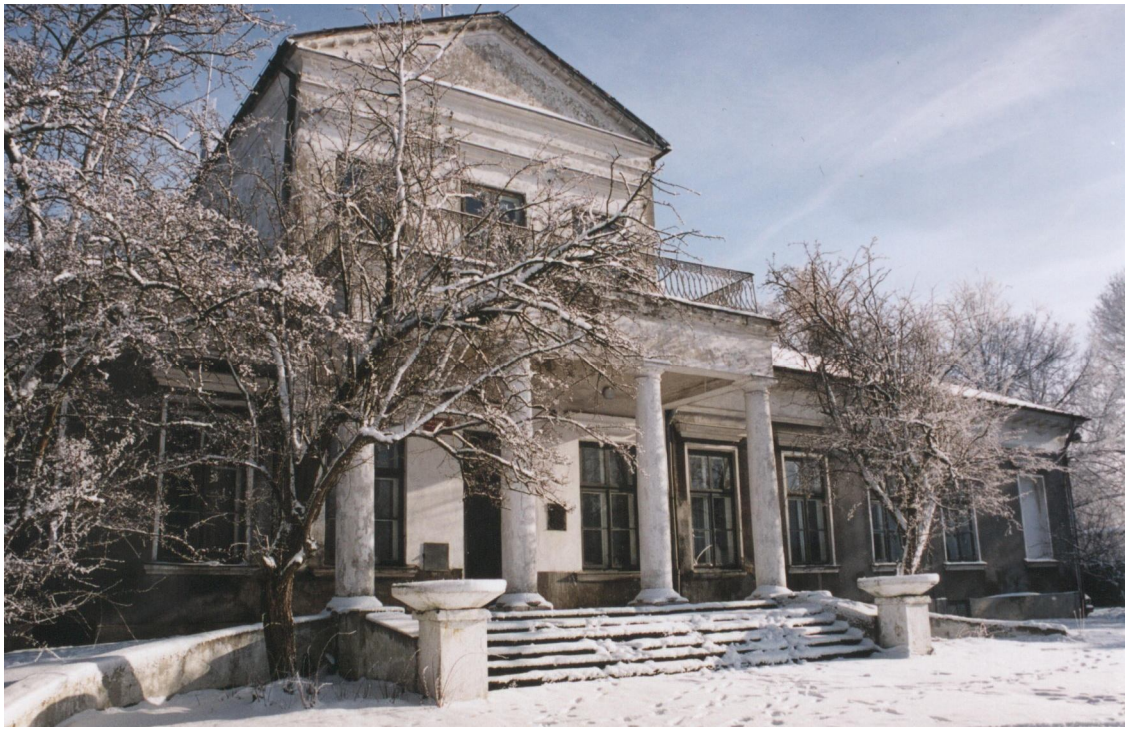
Pałac Zakrzewskiego - front