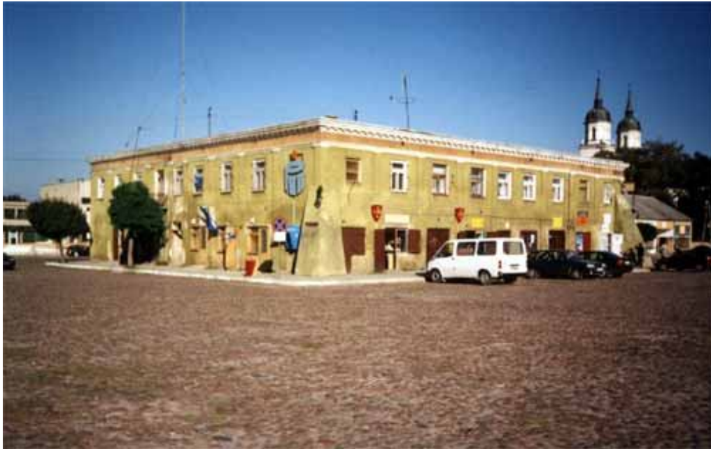
Rynek Zakrzewskiego w Żelechowie (ratusz)