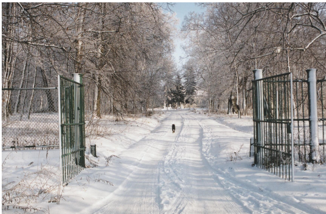
Brama wjazdowa do pałacu Zakrzewskiego