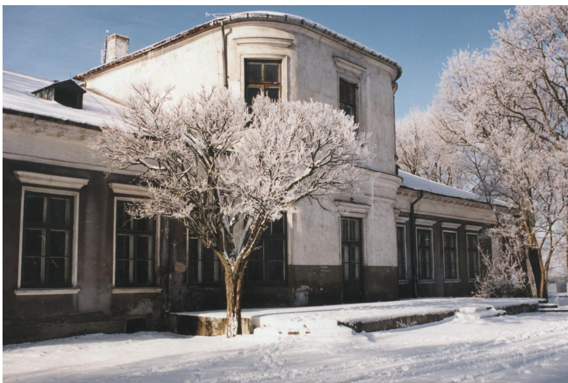
Pałac Zakrzewskiego - tył