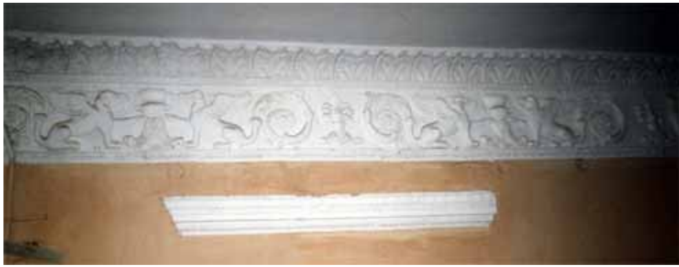
Ornamenty w pałacu Zakrzewskiego