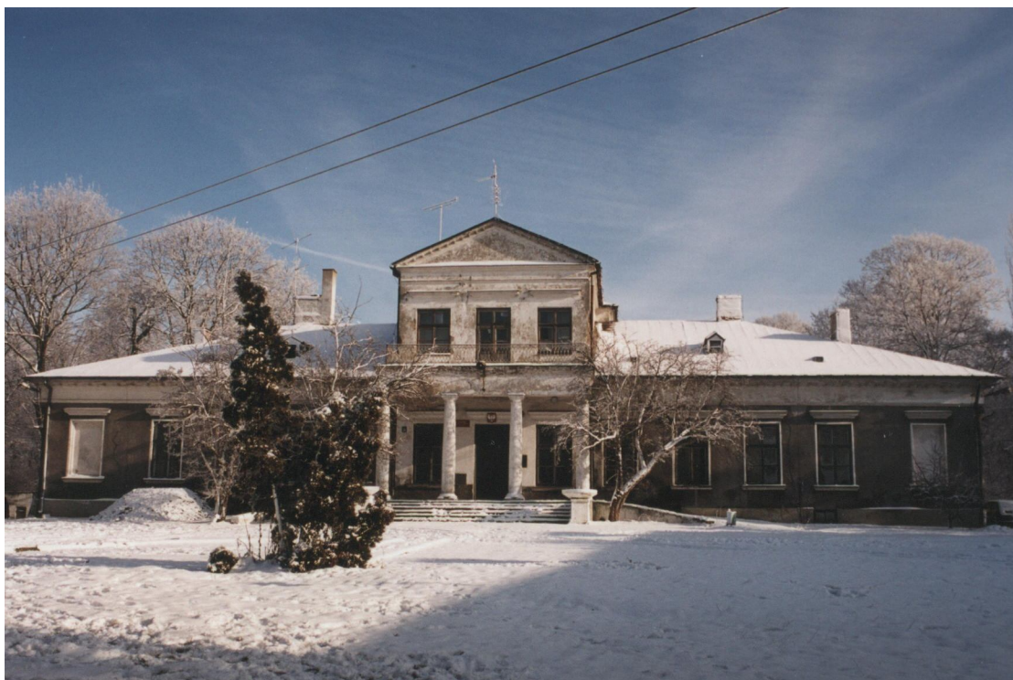
Pałac Zakrzewskiego – front