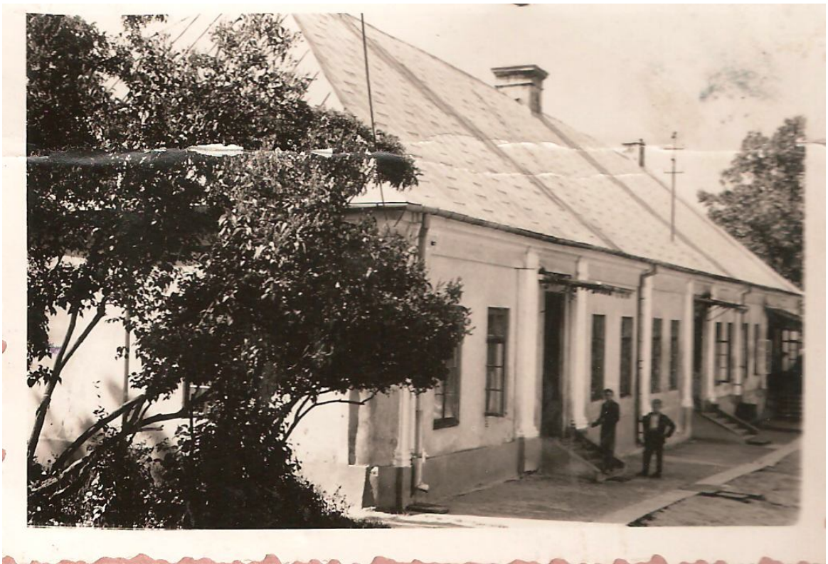
Pałac Zakrzewskiego internat Liceum Mechanicznego i Zasadniczej Szkoły Mechanizacji Rolnictwa 1958