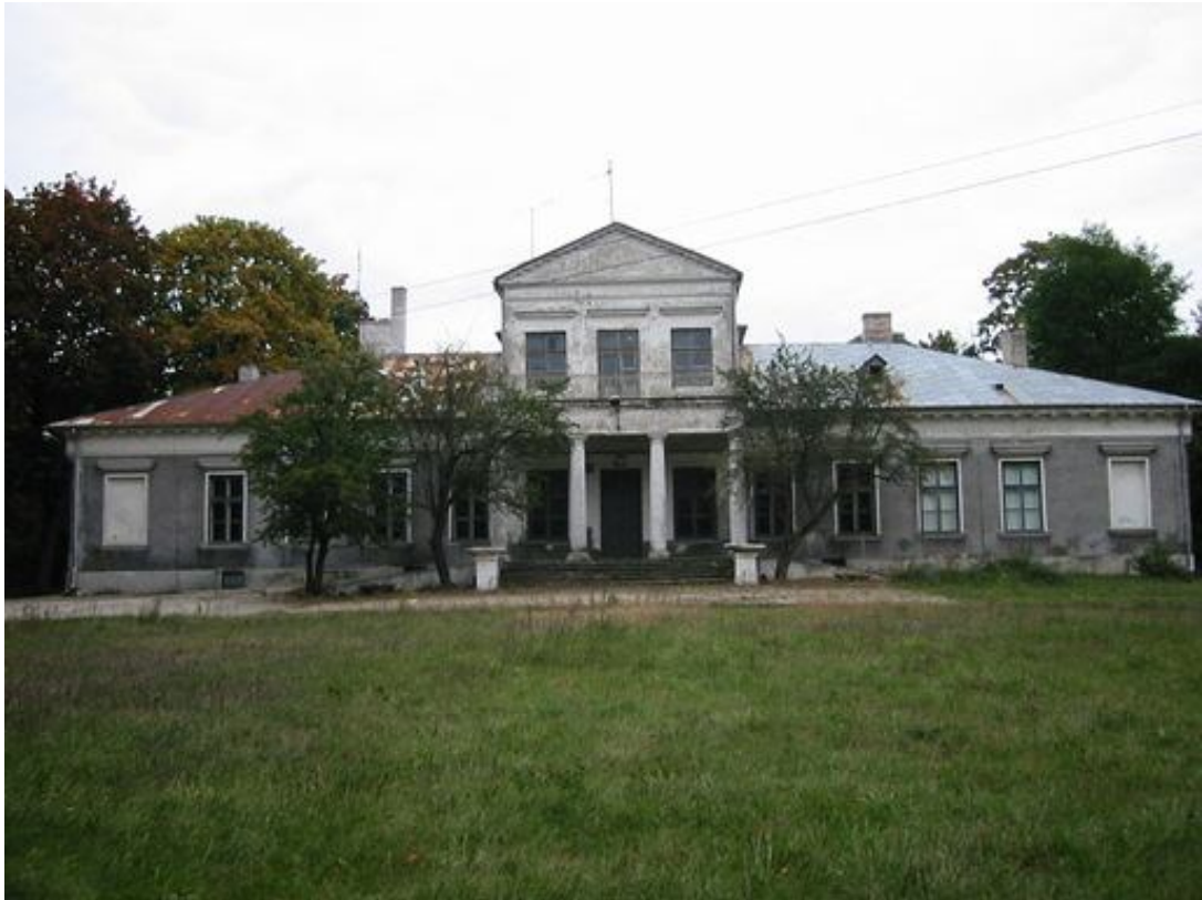
Pałac Zakrzewskiego - front