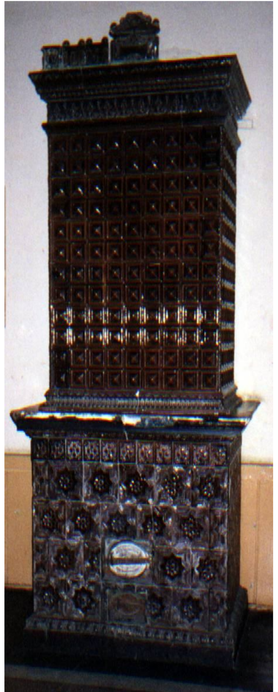
Piec kaflowy w pałacu (stan przed remontem)