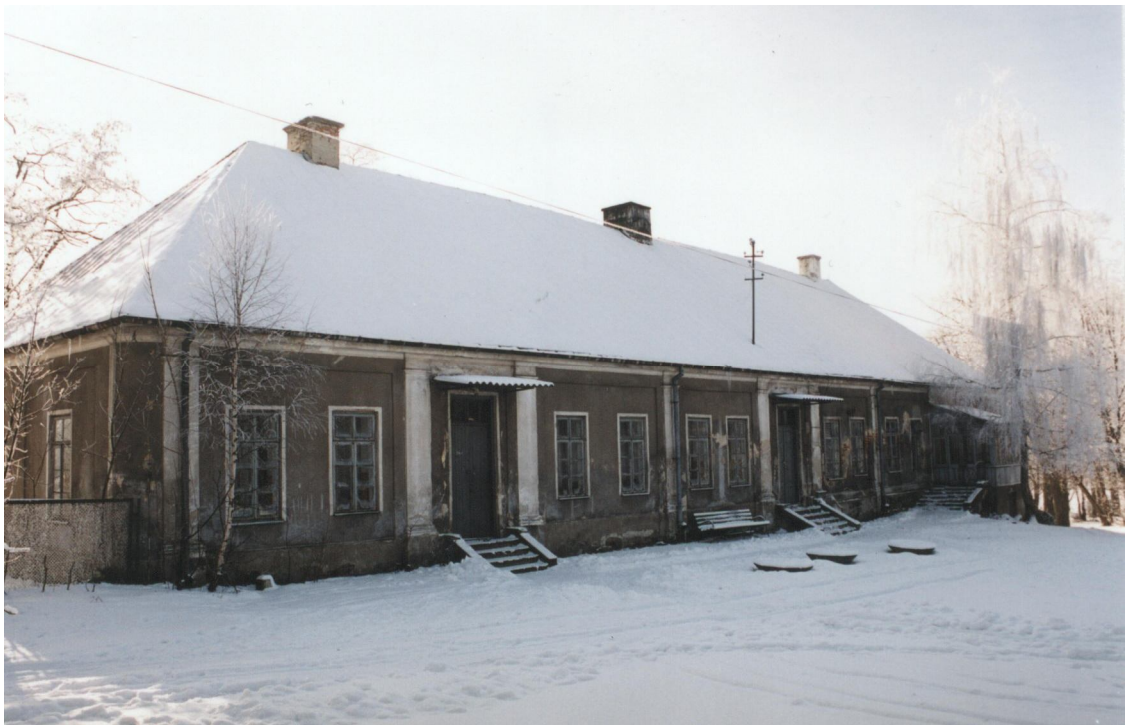
Oficyna Pałacu Zakrzewskiego