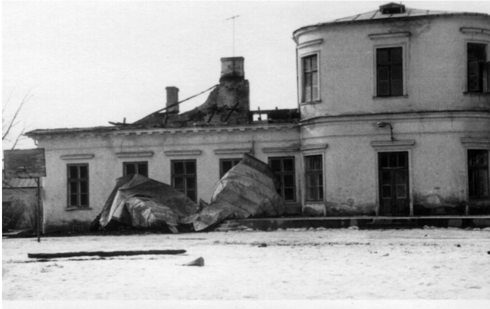
Pożar pałacu 1969r.