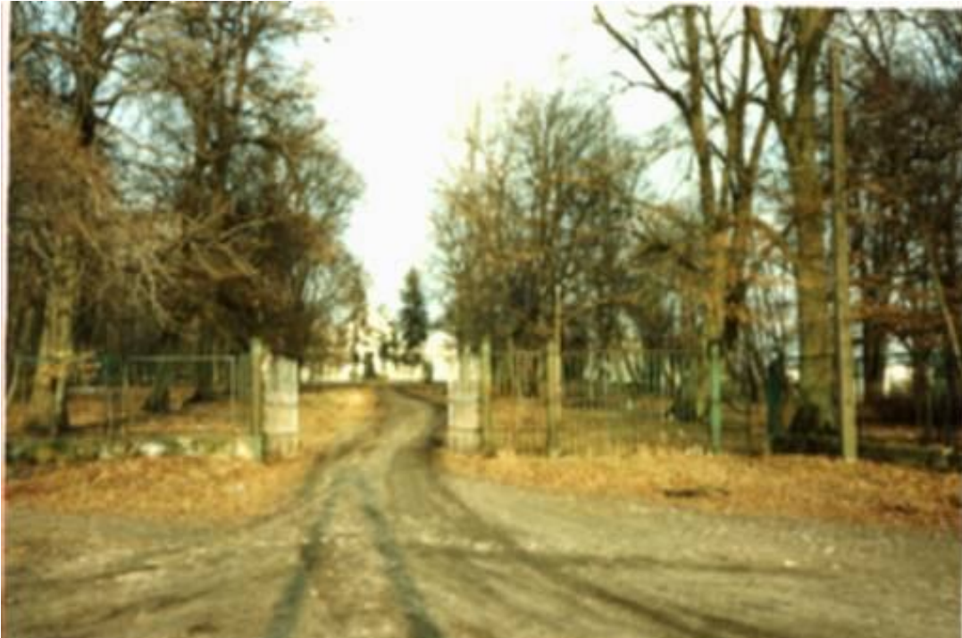
Pałac Zakrzewskiego - brama wjazdowa - lata 80. XXw.